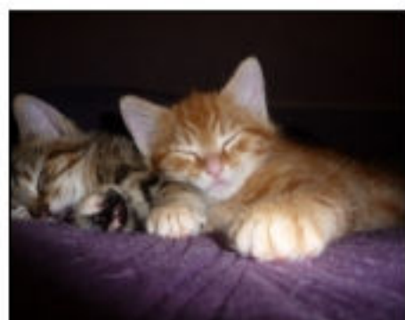
Gazouille et Galopin, 2 de nos adoptés 2011

Nous sommes également intervenus sur un gros sauvetage d'une quarantaine de chats que possédait une habitante de Lorient. Ce sauvetage a nécessité beaucoup d'énergie et n'aurait pu se faire sans l'entraide de diverses associations de protection animale. Sur ces 40 chats, nous avons géré la sortie de 16 chats, pour 11 d'entre eux nous avons assuré les soins vétérinaires et la quarantaine avant de les confier à d'autres associations car nous n'avons pas assez de place pour tous les accueillir.